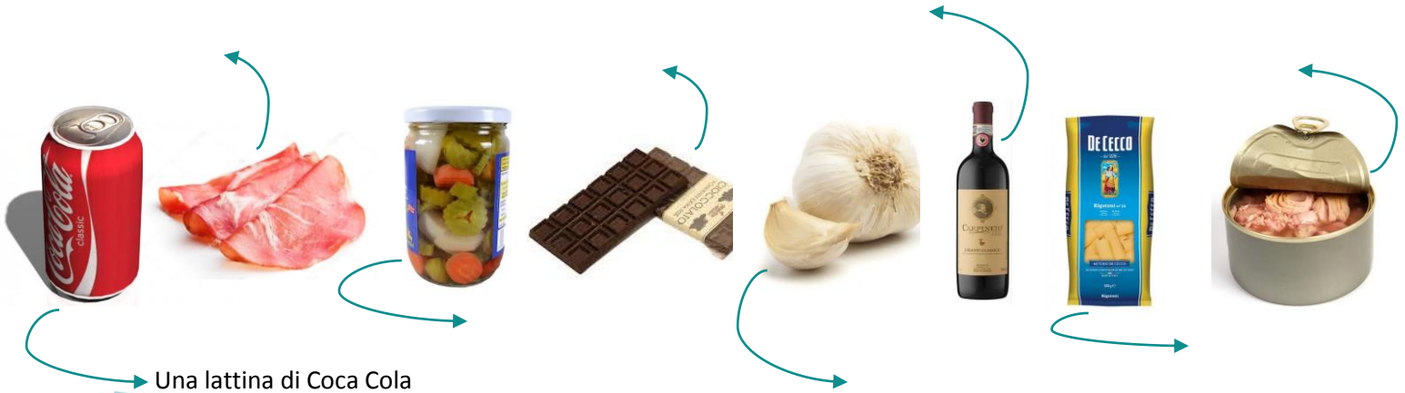
Una lattina di Coca Cola