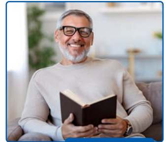
Lui ha un libro.