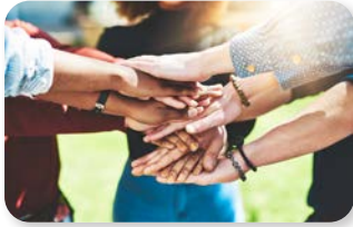
a. nelle associazioni