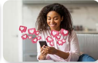
c. su internet