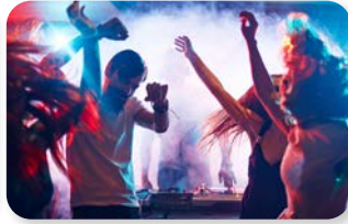
b. in discoteca