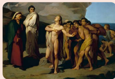
L'INCONTRO TRA DANTE E CASELLA DIPINTO DA AMOS CASSIOLI (1860)