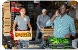
g. sul posto di lavoro