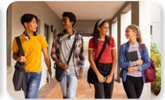
h. a scuola