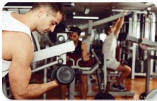
e. in palestra