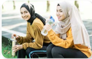
f. nei parchi