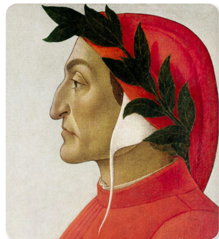
DANTE DIPINTO DA SANDRO BOTTICELLI (1860)

L’incontro con Casella è molto commovente: Dante non può abbracciare l’anima dell’amico morto, ma cantano insieme e ci mostrano come la morte non cancella l’amicizia e che la musica e la poesia possono aiutare ad affrontare il dolore.