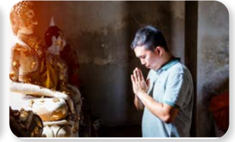
d. nei luoghi di culto